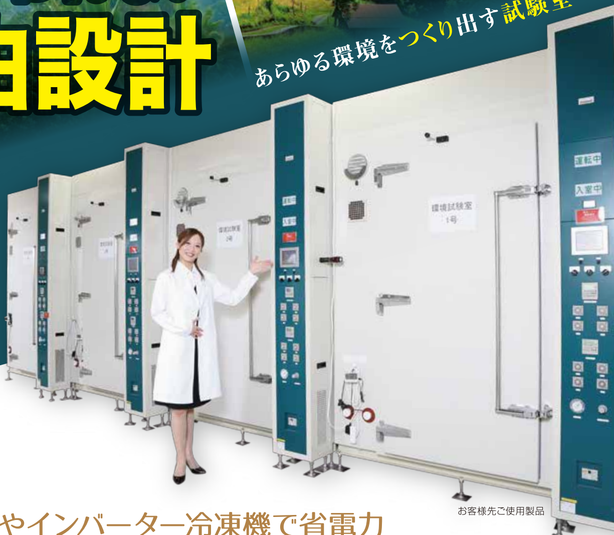
お客様先ご使用製品