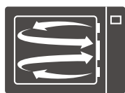
右部側面 吸い込み式