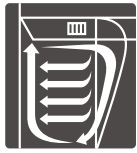
内槽背面 吹き出し式